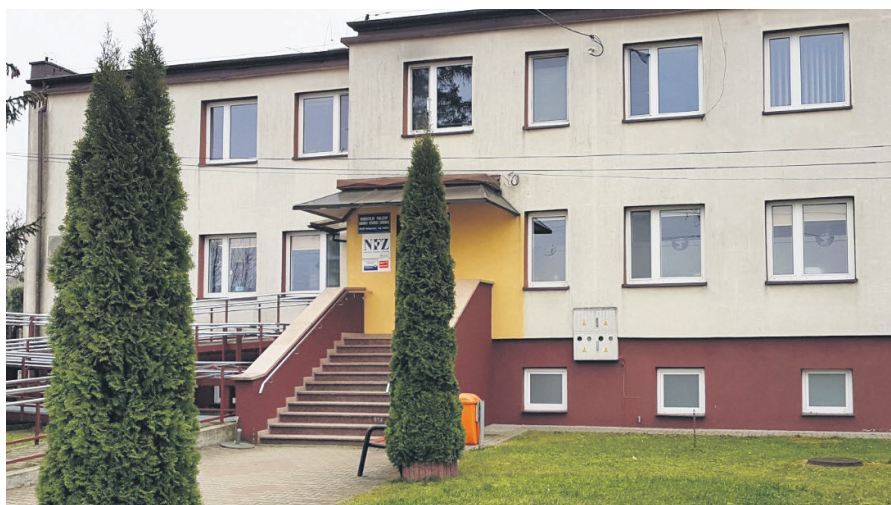
Zapisy prowadzone są w rejestracji SPGOZ Sulmierzyce

W 2017 roku zakupiono nowy przewoźny aparat ultrasonograficzny, charakteryzujący się szerokim zastosowaniem zarówno