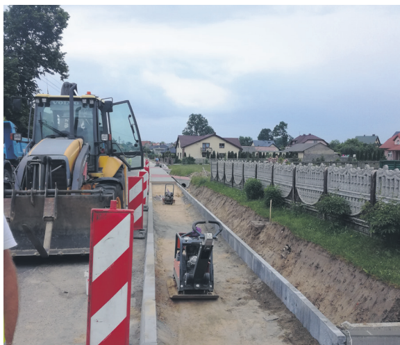
Przebudowa chodnika w Dworszowicach Pakoszowych

W roku 2017 zmodernizowano drogę dojazdową do gruntów rolnych w miejscowości Dworszowice Pakoszowe o długości 4311,7 m. Prace polegały na wzmocnieniu istniejącej konstrukcji jezdni, wykonano również poszerzenia jezdni do szerokości 5,0 m w granicach istniejącego pasa drogowego, utwardzono pobocza, natomiast krawędź jezdni w obrębie istniejących zjazdów na działki zabudowane zabezpieczono krawężnikiem najazdowym. Koszt inwestycji to ponad 2,4 mln zł.