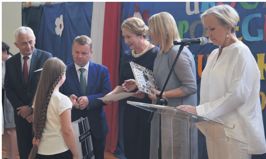
W czasie uroczystości wręczono stypendia uczniom z najlepszymi wynikami