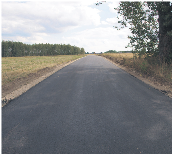
Nowa droga w Dworszowicach Pakoszowych