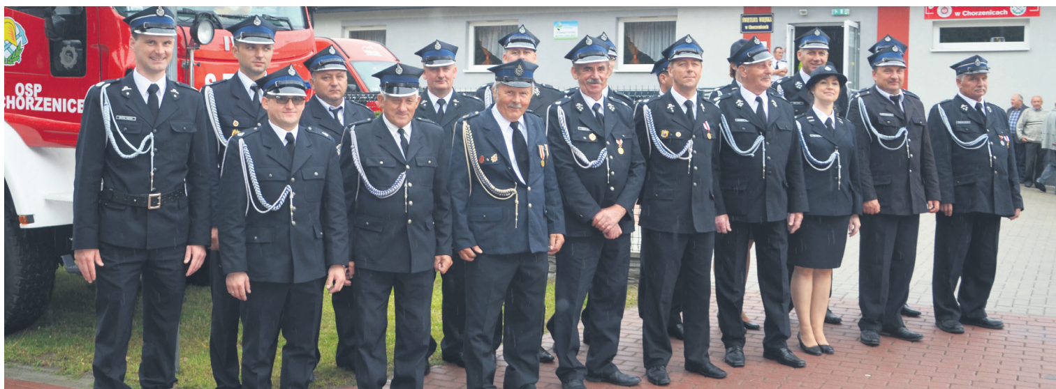
Strażacy z Ochotniczej Straży Pożarnej w Chorzenicach na tle nowego wozu podczas uroczystości z okazji 100-lecia istnienia jednostki