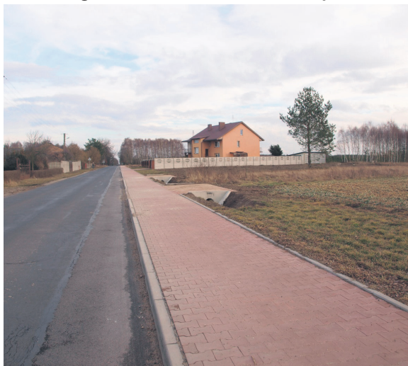
Przebudowa drogi - Kodrań

W roku 2016 za ponad 1,0 mln złotych przebudowano na odcinku ponad 2,3 km drogę dojazdową do gruntów rolnych i pojedynczych budynków jednorodzinnych w miejscowości Kodrań. Zakres prac obejmował wykonanie obustronnych poszerzeń jezdni na podbudowie z kruszywa, ułożenie w miejscach poszerzeń maty geokompozytowej, wykonanie warstwy wyrównawczej, wiążącej i ścieralnej z betonu asfaltowego, utwardzenie poboczy oraz istniejących zjazdów do granicy pasa drogowego poprzez wykonanie nawierzchni z kostki betonowej obramowanej krawężnikiem najazdowym oraz obrzeżem betonowym.